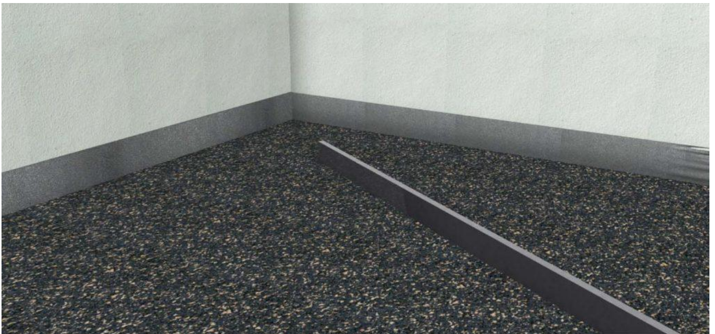
OBRAZ Č. 4

Zrolovať rolku kročajovej izolácie ISORUBBER BIO a uložiť na pripravenú vrstvu lepidla. V tesnej blízkosti zrolovať druhú rolku tak, aby bol vedľa a nie nad susednou rolkou.