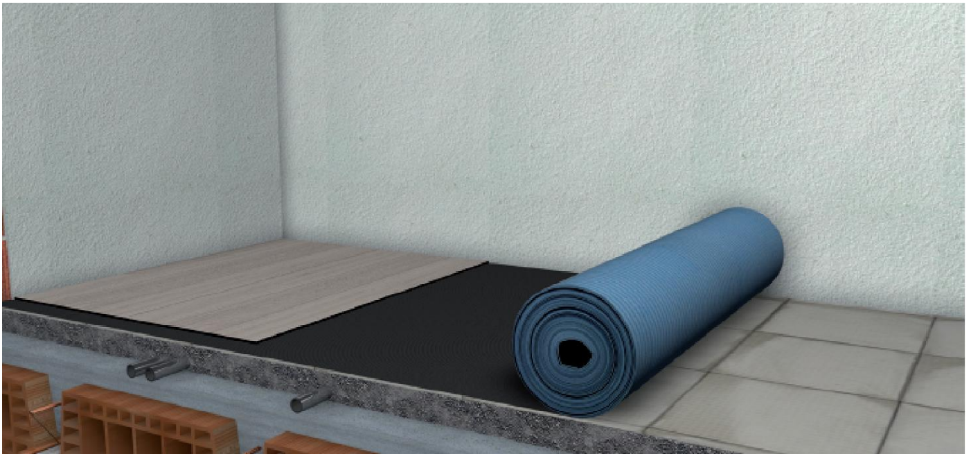
OBRAZ Č. 6 Je možné používať AKUSTIK SLIM nad už existujúce podlahy.