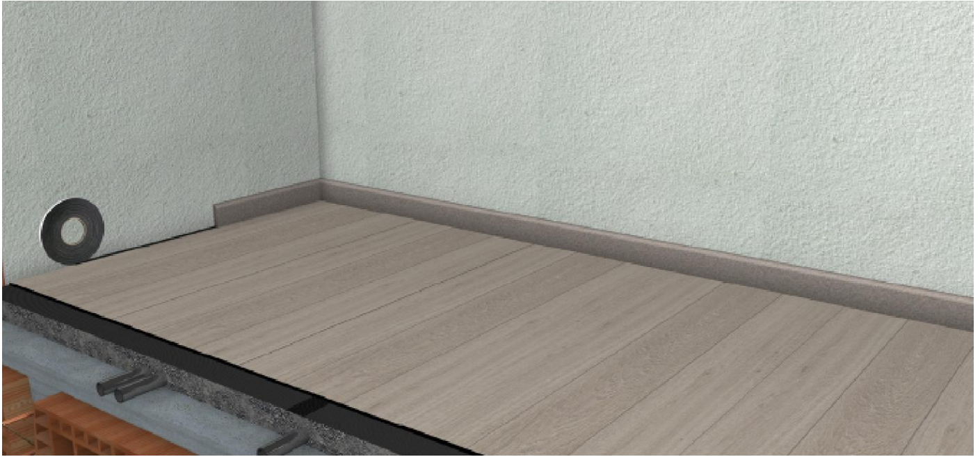
OBRAZ Č. 5 Pokladat sokel