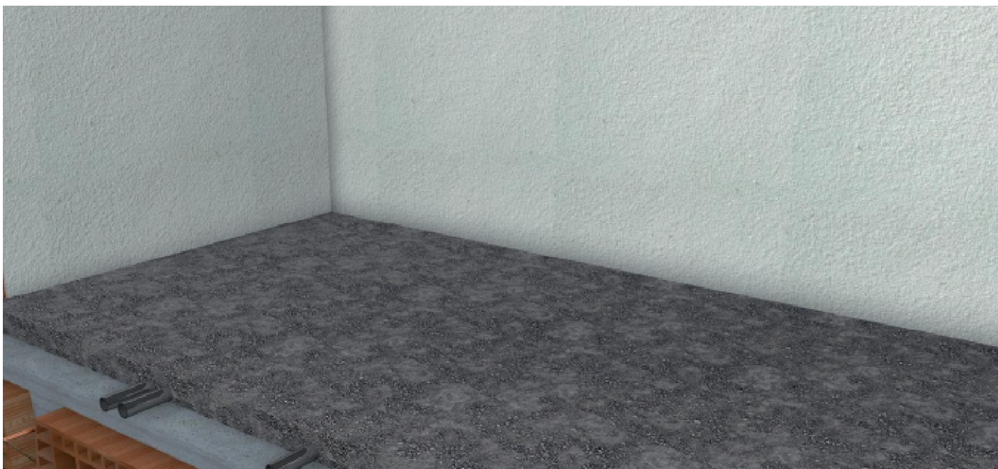
OBRAZ Č. 1

Skontrolovať vyrovnanie a vodorovnosť existujúceho cementového poteru.