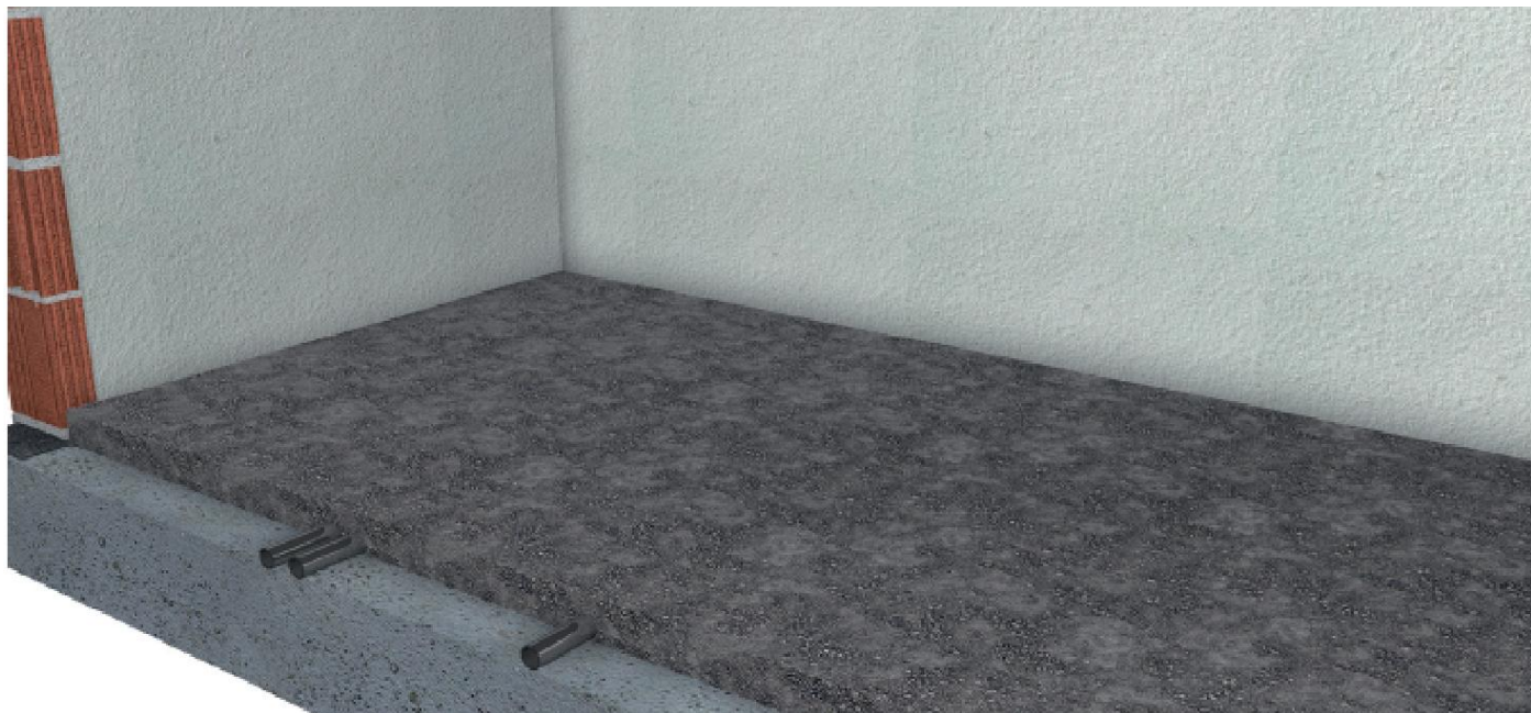
OBRAZ Č. 1

Skontrolovať vyrovnanie a vodorovnosť existujúceho cementového poteru.